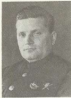
Камандуючы Дняпроўскай ваеннай флатыліяй у 1920 г. П. І. Смірнов