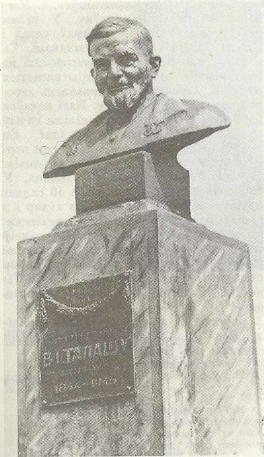
Помнік В. І. Талашу ў Петрыкаве. Скульптар Э. Азгур

мога, але дзе яе ўзяць, бо так і не выбраўся дзед з галечы.